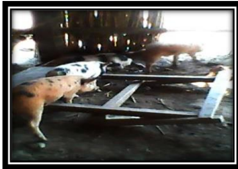
L'autonomisation des PoVIH pour l'auto prise en charge (Nyemba/ Tanganyika)