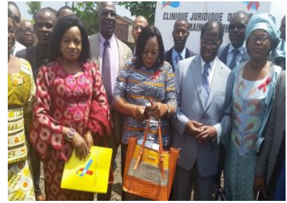
Inauguration de la Clinique Juridique UCOP+_CEDHUC par S.E le Ministre de la Justice