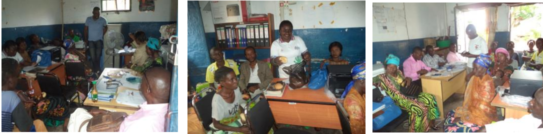
La sortie de la clandestinité des PoVIH et leur accueil dans les groupe de support (Kalemie/Tanganyika)