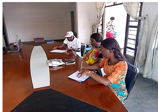
Lors de la réunion de rétroaction au PNMLS De gauche à droite: S&E/UCOP+, SEP/PNMLS et SEP/UCOP+

Le SEP PNMLS a pris acte et souhaite avoir un soubassement pour enrichir les échanges avec le PTF et autres partenaires susceptibles d'interférer dans la chaîne de distribution des intrants VIH/TB.